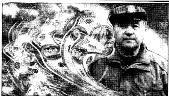
Коллаж из газеты «Измаильские ведомости» (23.04.1999 года).